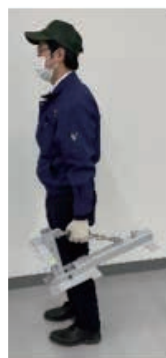
ベース・小物類 (約9kg)